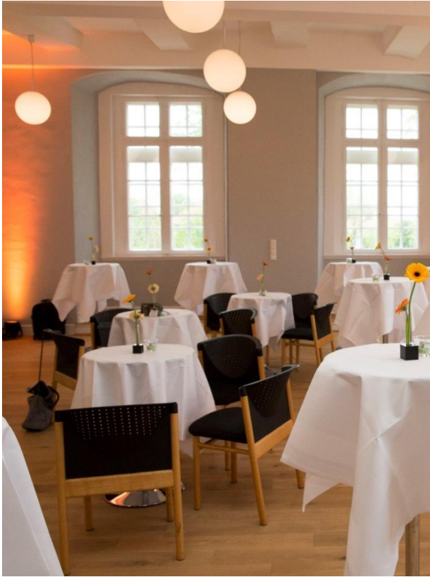
Kaminsaal, Region Hannover, 2014