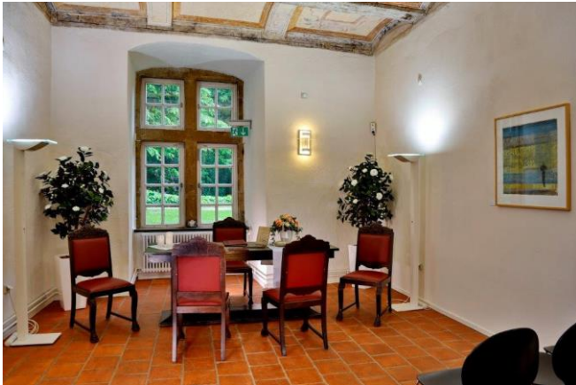
Herzog-Erich Gemach, Region Hannover, 2016

Nutzen Sie das historische Ambiente des Weserrenaissance-Schlusses, damit Ihr Festtag unvergesslich wird! Flanieren Sie mit Ihrer Hochzeitsgesellschaft durch den weitläufigen Amtsgarten. Stoßen Sie mit Ihren Gästen bei gutem Wetter auf den Leineterrassen an oder unter dem grünen Blätterdach der Kastanie im Innenhof.